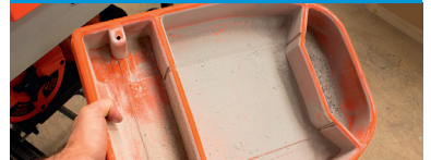
2-Kammer-Staubauffangbehälter für bis zu 5 kg Fein- und groben Staub